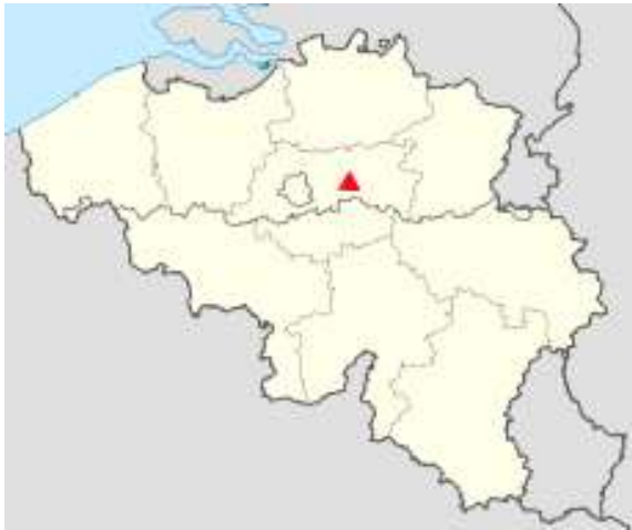
Fig. 1 Situering van de gemeente Heverlee.

Bij verbouwwerkzaamheden in een woning aan de Waversebaan van de Leuvense deelgemeente Heverlee, kwam bij het uitbreken van een vloer een gedeeltelijk bewaarde geldbeugel aan het licht 1 . Deze bevond zich in een losse zandige vulling en zowel binnenin als rond de leerfragmenten bevonden er zich talrijke munten.