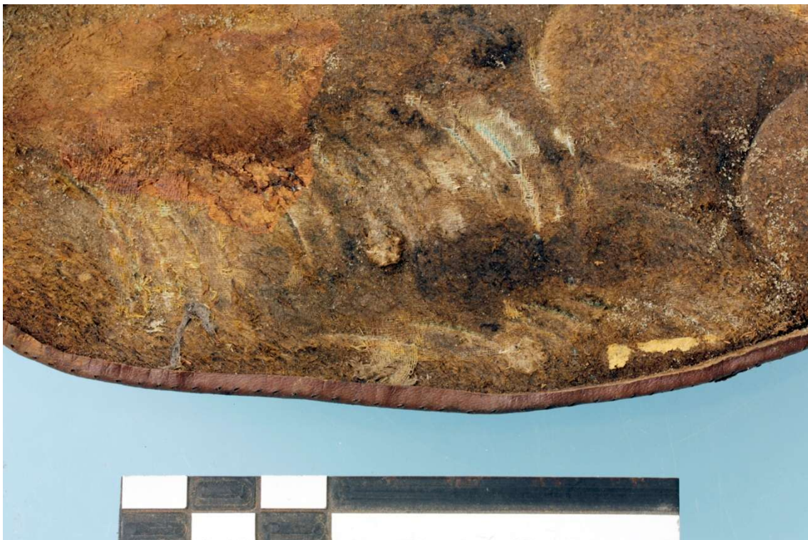
Fig. 5 Detail van de indrukken van de munten op het binnenoppervlak van de geldbeugel.