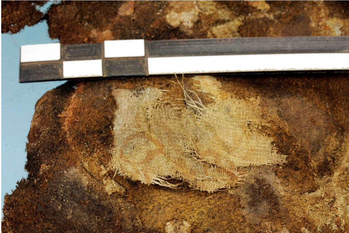
Fig. 8 Detailopname van de textielresten met decoratiepatroon aan de binnenzijde van de geldbeugel.