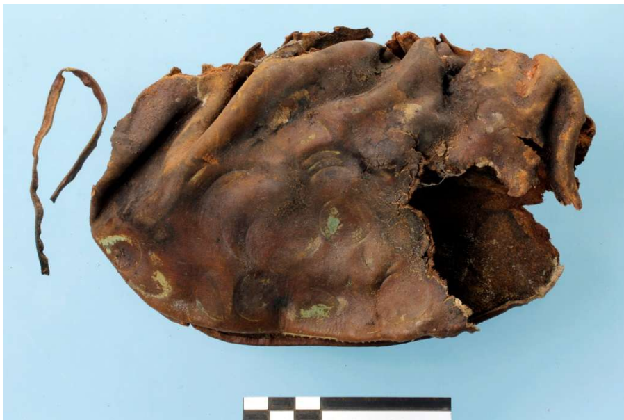
Fig. 2 De geldbeugel bestaande uit twee delen en een verbindingsstrookje.