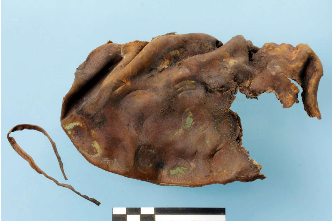
Fig. 4 Zicht op het buitenoppervlak met de duidelijk waarneembare indrukken van munten.