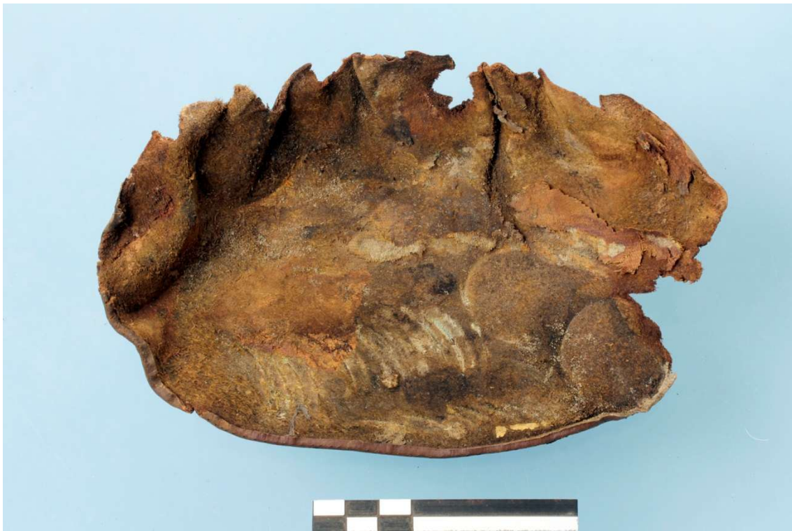
Fig. 3 Binnenzijde van één der panden met daarop de indrukken van de muntstukken.

Van de oorspronkelijke geldbeugel zijn drie fragmenten bewaard gebleven. Het gaat om twee min of meer ovale stukken leer (breedte: \pm 20 cm – hoogte: \pm 13 cm) en één smal, in de langsrichting gevouwen leerstrookje (breedte: 0,8 cm – lengte: 16 cm) (fig. 2). De fragmenten zijn vrij sprok, gedeeltelijk beschadigd en vervormd door het verblijf in de bodem. De twee panden vertonen zowel aan de binnen- als buitenzijde de indrukken van munten in het leeroppervlak (fig. 3-5). De randen van de geldbeugelpanden alsook het leerstrookje vertonen kleine vlees-nerfsteken (tussenafstand 3 mm). Deze zijn zo regelmatig en uniform dat ze machinaal zijn gerealiseerd. Beide panden zaten door middel van een aansluitende naad aan elkaar bevestigd. Het leerstrookje bevond zich oorspronkelijk aan de binnenzijde van de geldbeugel tussen de beide randen van de panden. Dit bandje zorgde waarschijnlijk voor een soepeler naad 2 . Het gebruikte leer voor deze geldbeugel is kalfsleer (determinatie door middel van een monoculair met 10 x vergroting). De bovenzijde van de geldbeugel is sterk beschadigd, waardoor niet vast te stellen is hoe de geldbeugel oorspronkelijk gesloten werd. Op enkele plaatsen lijken er snijsporen vast te stellen. Het zou kunnen dat een metalen (scharnierend?) sluitingsframe, verwijderd werd vooraleer de geldbeugel in de grond gestopt werd.